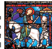
Cathédrale de Chartres

Soldat romain né en Hongrie au début du 4 ème siècle, Martin est muté en Gaule et c'est là, qu'à Amiens, il rencontre le pauvre grelottant à qui il donne son manteau et dont il apprend durant la nuit que c'est le Christ qui lui a fait cette demande. Converti, il rejoint St Hilaire, évêque de Poitiers, avec qui il fonde le premier monastère des Gaules, à Ligugé. Proclamé évêque par les habitants de Tours, St Martin n'en n'oublie pas pour autant les pauvres, sillonnant la campagne pour évangéliser. Il mourut le 8 novembre 397, à Candes, près de Tours.